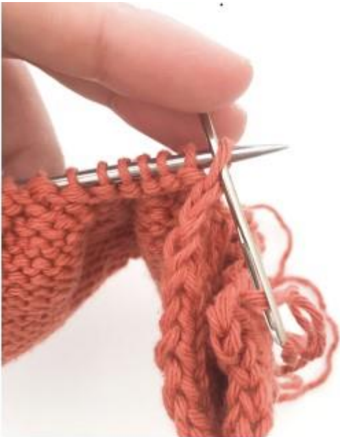
Imagen 2: Tirar de la aguja para cerrar los puntos