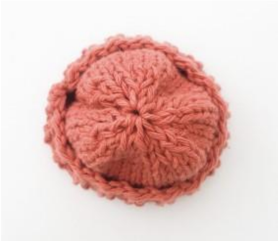
Imagen 1: Desmontar puntos de la aguja