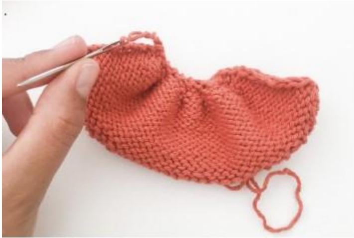
Imagen 3: Coser ambos extremos